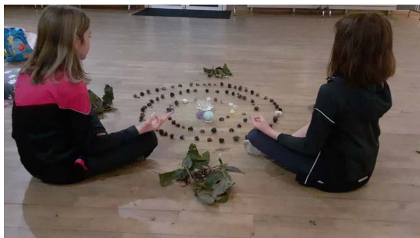
Mandala réalisé avec les jeunes adolescentes du cours du jeudi