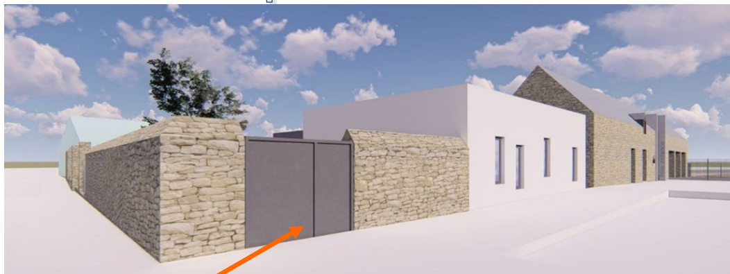
Entrée espace jeunes